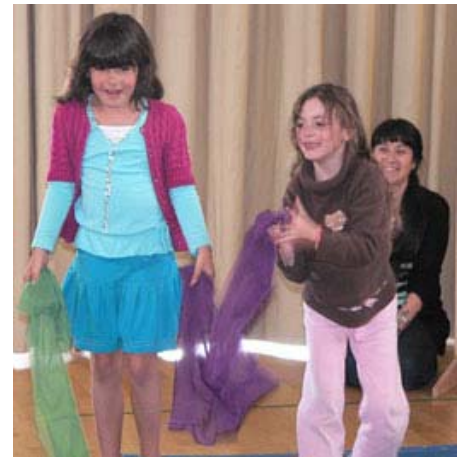
Arriba y abajo: dos escenas de K-1's Talent Time "" el martes!

Actualización de la Comisión de Búsqueda Jefe El comité para determinar la contratación de una permanente, a