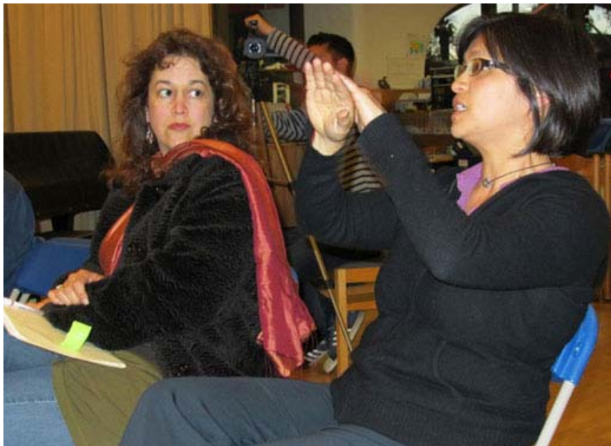
Arriba: Un animado debate durante el padre de acreditación ed. evento la noche del martes. Abajo: Acuarela de trabajo en el CEC.