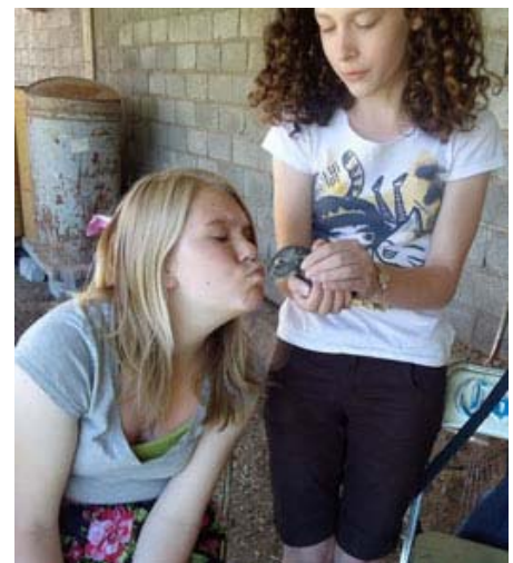
Arriba: Los conejos del bebé se robó el show durante un taller de cuidado de animales en El Molino. Abajo: Navegando por el laberinto de sauce en la ECC.