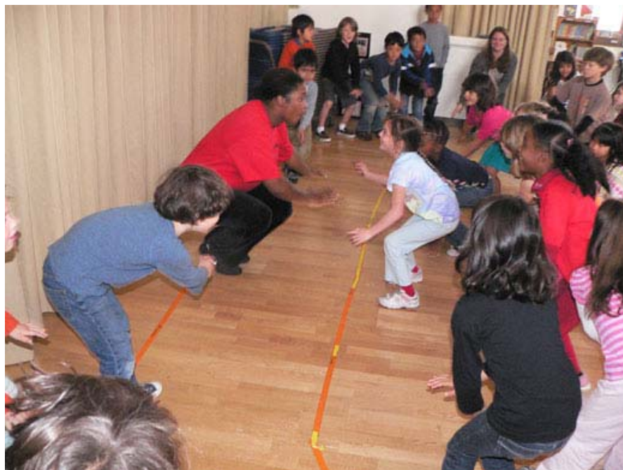
Arriba: Caras sonrientes en Carpenter hip hop dance lección Teela Abajo: ¿Quién sabe cuando los maestros y directores de la Escuela entrar en el grupo de hip-hop? La Sombra sabe

carta con información más detallada se procedentes de Director de la Escuela Mitch Bostian sobre el tema la próxima semana. Visita de acreditación "asociaciones sitios web de nuestros: www . caisca.org y www.acswasc.org .