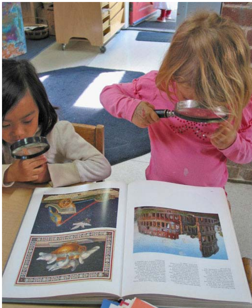
Arriba y abajo: Los estudiantes de ECC estudió por primera vez mosaicos, y luego creó su propia clase de arte.

Temescal Creek y Sweet Briar Creek celebrarán su día anual de la playa el viernes, 4 de junio. Los estudiantes y sus profesores visitarán Corazón deseo hermosa playa en la Bahía de Tomales. Complete la información vendrá de la clase de su hijo. Oren por el buen tiempo!