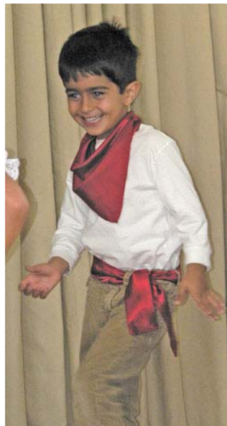
Arriba y abajo: Más escenas de la gala de la danza mexicana peruana rendimiento Laurel.